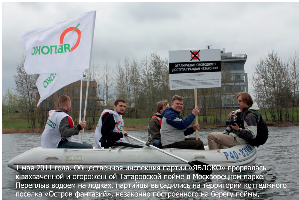
1 мая 2011 года. Общественная инспекция партии «ЯБЛОКО» прорвалась к захваченной и огороженной Татаровской пойме в Москворецком парке. Переплыв водоем на лодках, партийцы высадились на территории коттеджного поселка «Остров фантазий», незаконно построенного на берегу поймы.