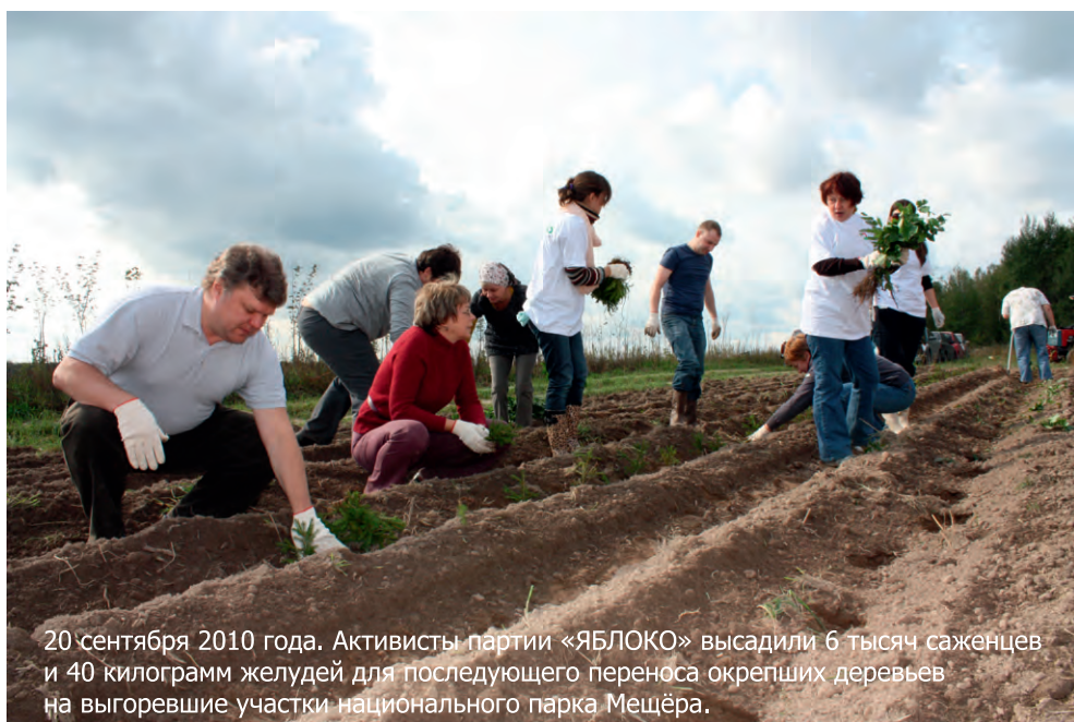
20 сентября 2010 года. Активисты партии «ЯБЛОКО» высадили 6 тысяч саженцев и 40 килограмм желудей для последующего переноса окрепших деревьев на выгоревшие участки национального парка Мещёра.