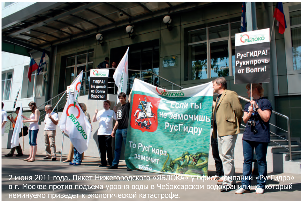
2 июня 2011 года. Пикет Нижегородского «ЯБЛОКА» у офиса компании «РусГидро» в г. Москве против подъема уровня воды в Чебоксарском водохранилище, который неминуемо приведет к экологической катастрофе.